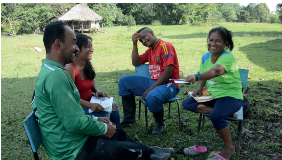
Amazonia 2.0- Taller de gobernanza intercultural. 2019